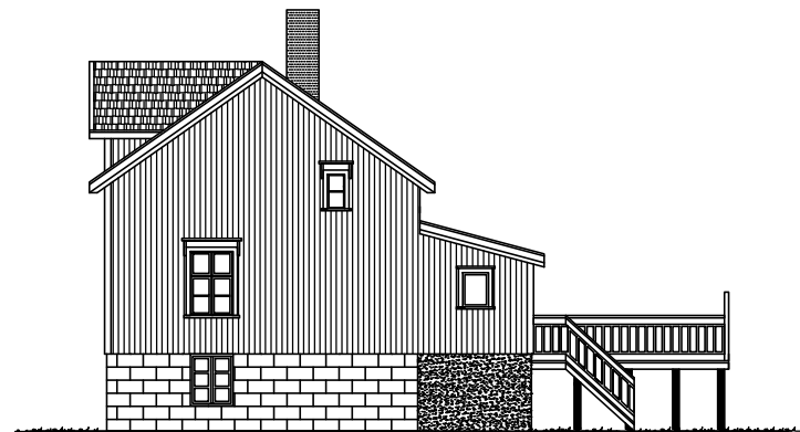
FASADE MOT ØST