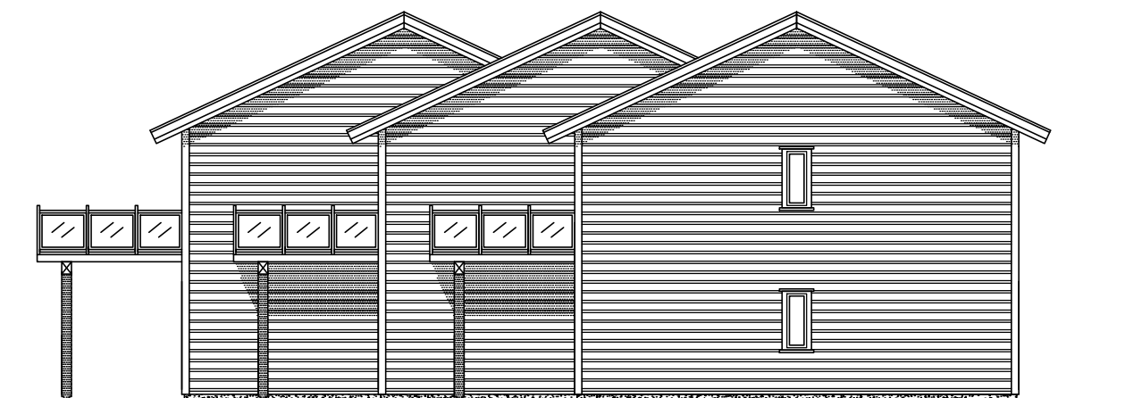
FASADE MOT SØRØST