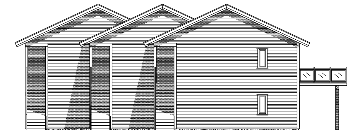
FASADE MOT NORDVEST